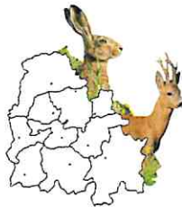
GIC du Bocage